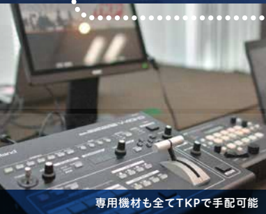
専用機材も全てTKPで手配可能