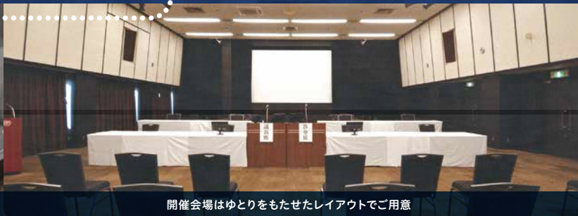
開催会場はゆとりをもたせたレイアウトをご用意