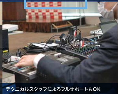
テクニカルスタッフによるフルサポートもOK